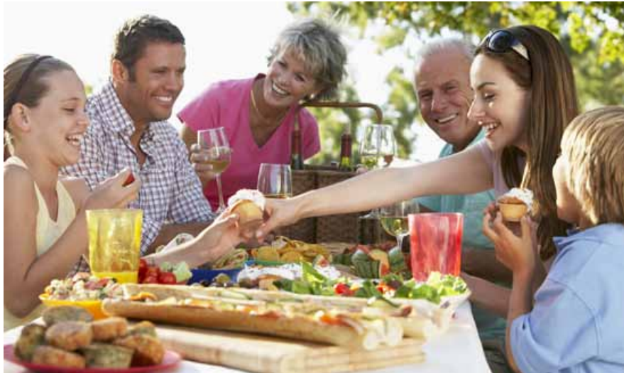
Auch während der Sommerhitze war ein gemütlicher Besuch in unseren Gäststätten, Cafés oder beim Heurigen sehr beliebt.

Trismauer mit seiner hohen Lebensqualität und den unendlichen vielen Freizeitmöglichkeiten hat besonders in diesem Sommer gezeigt, wie gut es tut, ein derartiges Angebot genießen zu können. War es,