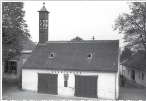
Feuerwehrrequisiten-Schuppe – Spritzenhaus – Café – China-Restaurant, der vielseitige Verwendungszweck des Hauses am Gartenring Nr. 26 deutet auf eine bewegte Geschichte hin.

Lösch auf dem Hauptplatz geschlossen, weil der Hausbesitzer Franz Scherzer sein Kaufhaus vergrößern will, und am 28. Oktober im gleichen Jahr wird das in der Nähe der Traisenbrücke neu erbaute, zeitgemäße Feuerwehrhaus, das auch die landwirtschaftliche Fortbildungsschule beherbergt, eingeweiht.