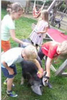
Viel Spaß hatten die Kinder beim gemeinsamen Ausflug mit den Tieren.

■ In den Sommerferien wurde den Kindern in den Räumen der Nachmittagsbetreuung in der Volksschule Trismauer ein abwechslungsreiches Programm geboten. Die Betreuung fand alle neun Ferienwochen statt. Wie zum Beispiel beim gemeinsamen Ausflug „Zeit mit Tier“, durften die Kinder den Begegnungsort Mensch und Tier kennenlernen. Neben vielen verschiedenen Tieren die gefüttert, gebürstet und gestreichelt wurden, gab es auch die Möglichkeit zum Ponyreiten. Zum Ferienprogramm zählte auch ein spannender Experimenten-Tag. Experimente wie der Geist im Gummihandschuh, Wasser mit Klebkraft und der Frosch auf Tauchfahrt, sorgten wie viele weitere Aktivitäten für große Begeisterung.