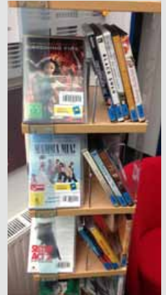
Neu im Programm sind nun DVD's zum Ausleihen – von Klassikern bis zu Komödien, Kinderfilmen, Krimis ...

■ Das erwartete Sommerloch ist erfreulicherweise ausgeblieben! Die Traismauer LeserInnen haben die Bücherei auch im Juli und August sehr stark frequentiert. Überhaupt entwickeln sich die Entlehnungen sehr positiv – das Angebot an neuen Büchern wird gut angenommen, und so konnte die Stadtbücherei im ersten Halbjahr bereits einen starken Zuwachs an Lesern verzeichnen. Ein herzliches Danke an dieser Stelle – auch an jene Leser, die der Bücherei über all die Jahre die Treue gehalten haben.