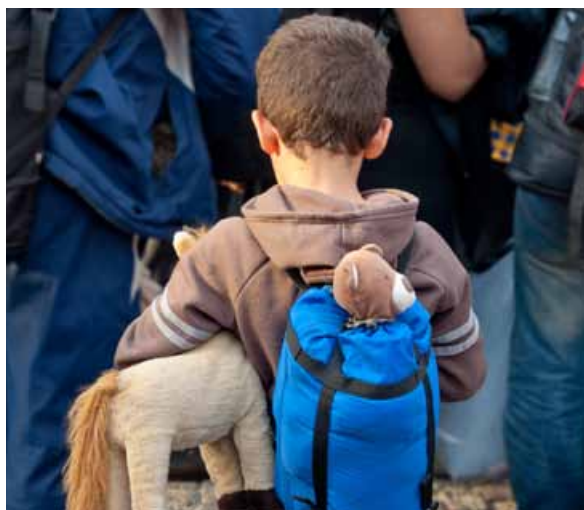
Verschließen wir uns bitte nicht! Zeigen wir Menschlichkeit und helfen geschwächten Menschen, die unvorstellbare Strapazen bei ihrer Flucht überlebt haben.

Unsere Bestrebungen sind, kleine Wohneinheiten zu ermöglichen, die aufgeteilt im Gemeindegebiet eine bestmögliche Integration voraussetzen und darüber hinaus auch ein friedliches Zusammenleben mit der Bevölkerung garantieren. Natürlich müssen wir Verständnis aufbringen und dürfen uns dieser neuen Situation nicht verweigern. Wenn