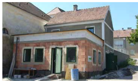
Jugendtreff Wagram aktuell – Eine Großbaustelle ist derzeit das Wagramer Milchhaus. Der desolate Teil des Gebäudes wurde bereits abgerissen und ein neuer Zubau, in dem der Wagramer Jugendtreff integriert wird, errichtet. Die Arbeiten sind bereits weit fortgeschritten, sodass beim 5. Wagramer Wandertag Teilbereiche benützt werden können.