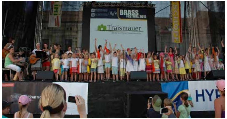
Die Kindergärten in Trismauer waren auch beim diesjährigen Brassfestival eingeladen, mitzumachen. Den Kindern und den Kindergartenpädagoginnen machte es großen Spaß, auf einer „echten“ Bühne zu stehen und gemeinsam zu singen, zu spielen und zu tanzen.

Im neuen Musikheim wird mittlerweile schon fleißig für das bevorstehende Cäcilienkonzert geprobt. Dieses findet am 22. November 2015 in der Stadtpfarrkirche Trismauer statt.