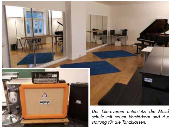
Der Elternverein unterstützt die Musikschule mit neuen Verstärkern und Ausstattung für die Tanzklassen.