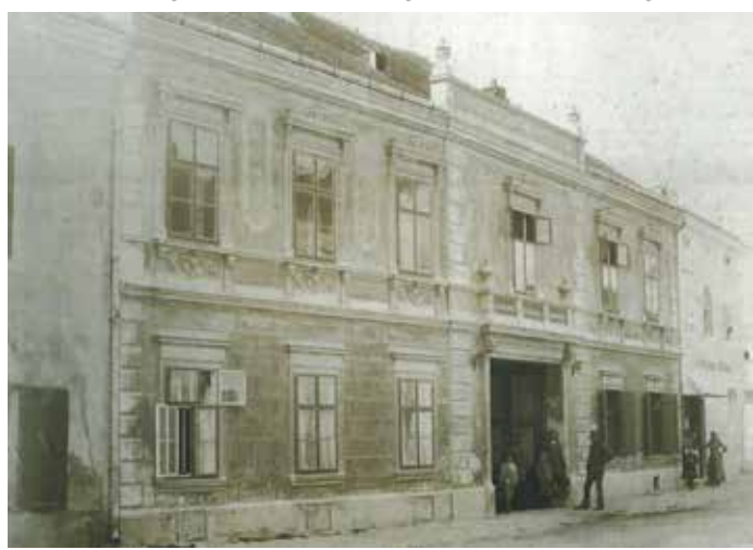
Das Gasthaus „Zu den 3 Kronen“ gehörte zu den ältesten unserer Stadt und wurde bis 2014 betrieben. In diesem Haus befand sich auch lange Zeit eine Bierbrauerei, deren Gewerbe-genehmigung 1926 gelöscht wurde.