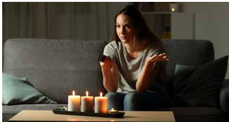
Was tun, wenn Informationen aus Rundfunk und TV ausbleiben?

Wenn Sie für den ASBÖ Samariterbund Trismauer spenden möchten, ist dies gerne per Banküberweisung möglich: Samariterbund Trismauer , IBAN: AT81202190010009919, BIC: SPHEAT21XXX.