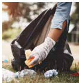
Initiativen aus einzelnen Haushalten sind willkommen und werden vom Umweltamt unterstützt.

■ Der jährlich im Frühjahr durchgeführte Gemeindeputztag kann auf Grund der derzeitigen COVID-19 Situation nicht stattfinden und wird daher auf Herbst 2021 verschoben! Eine frühzeitige Information zum Termin im Herbst 2021 erfolgt durch die Stadtgemeinde Trismauer.