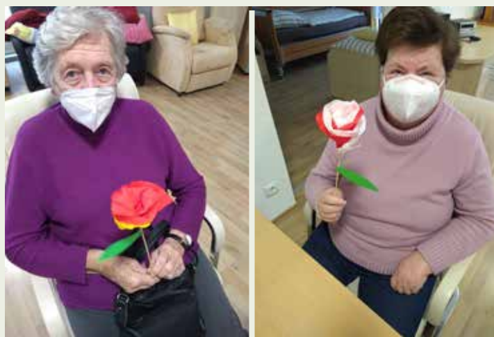
Zum Valentinstag bastelten die Gäste Blumen aus Krepppapier, wodurch der Frühling im Tageszentrum Einzug halten konnte und auch so manches Herz höher schlagen ließ.

Sollten auch Sie oder Ihre Angehörigen Interesse haben, das Tageszentrum regelmäßig zu besuchen bitten wir Sie uns unter der Telefonnummer