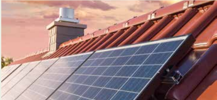
Beide Förderungen sind gut dotiert und sollten daher nicht binnen Tagen ausverkauft sein. Im Vorjahr waren die Fördermittel erst zur Jahreshälfte verbraucht.

■ Mit Stand 16. Februar 2021 gibt es für Privatpersonen 2 Möglichkeiten sich eine Photovoltaik (PV) Anlage fördern zu lassen.