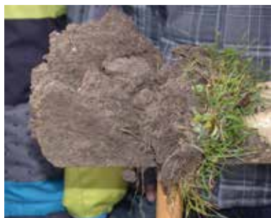
Gesunder Boden ist wichtig für den Garten.

Unter „Mulchen“ versteht man Bodenbedeckung mit unverrottetem organischem Material (angetrockneter Grasschnitt, Laub, usw.). Es bietet im Gegensatz zu offenem Boden viele Vorteile: Erhöhung des Humusgehaltes, weniger Verdunstung, Unterdrückung von Beikräutern, Förderung des Bodenlebens, usw.