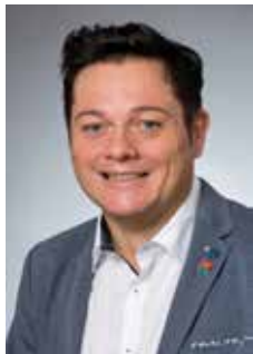
Bürgermeister Herbert Pfeffer