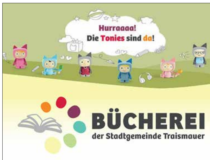
„Willkommen in der Welt der Tonies!“ – so lautet das Motto der Stadtbücherei Trismauer. Die kleinen Figuren stehen für ein Hörspielabenteuer im Kinderzimmer bereit.