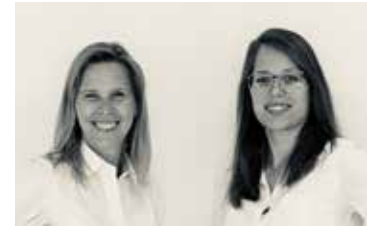
Das Team der Chyba & Engelmayer Rechtsanwältinnen steht Ihnen für Rechtsberatungen jederzeit gerne zur Verfügung. Die Kanzlei befindet sich am Bahnhofplatz 17 in 3100 St. Pölten, nähere Infos unter ce-recht.at .

Das Gesetz unterscheidet bei Immissionen zwischen unmittelbaren und mittelbaren Einwirkungen auf das Nachbargrundstück. Je nachdem, ob die Tätigkeit des einen Eigentümers unmittelbar auf die Einwirkung gerichtet ist oder ob diese nur zufällig eintritt. Zu den unmittelbaren Zuleitungen gehören zum Beispiel Zuleitungen von Ab- und Niederschlagswässern durch Rohre oder Rinnen. Unmittelbare Zuleitungen sind ohne besonderen Rechtstitel unter allen Umständen unzulässig. Mittelbare Zuleitungen sind hingegen nur dann unzulässig, wenn das nach den örtlichen Verhältnissen gewöhnliche Maß überschritten wird und die ortsübliche Benutzung des betroffenen Grundstücks wesentlich beeinträchtigt wird. Nach ständiger Rechtsprechung des Obersten Gerichtshofes stellen Lärmeinwirkungen eindeutig mittelbare Immissionen dar und können daher nur unter gewissen Umständen untersagt werden. Dennoch ist in solchen Fällen immer auf den Einzelfall abzustellen. Erst vor einigen Monaten befasste sich der Oberste Gerichtshof mit einer Luft-Wasser-Wärmepumpe. In diesem Fall wurde die Frage,