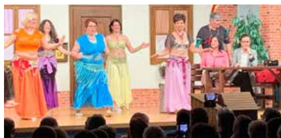
Schöffl's Theatergruppe 2019, Archivfoto.

Auch wenn Lachen und Unterhaltung wichtig sind, können wir zum Schutz der Gäste, der Theatergruppe und unseres Teams keine Aufführung darbieten. Ich darf Sie liebe Besucherin, lieber Besucher um Geduld bitten, auch wenn es noch dauert: „Schöffl's Theatergruppe“ wird wieder auf der Bühne stehen und Sie unterhalten.