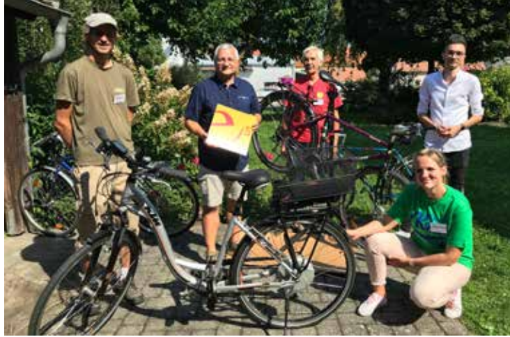
Das 1. Fußabdruck Festival Trismauer mit den Programmpunkten Autofreier Umwelttag, Frizzante-Shopping, Run4Bees und Run4Trees, Reparaturcafé, Kindertheater, Wirtschaftsbund-Lounge und dem 10-Jahres-Jubiläum der Fine Art Galerie fand am 12. September 2020 statt.

kannten, Freunden, Bürgerinnen und Bürgern habe ich wahrgenommen, dass für jeden diese Zeit äußerst unterschiedlich verlaufen ist. Für manche war der Lockdown und die Wochen danach ein lang ersehnter Stopp im ewigen Hamsterrad, ein Ausbrechen aus der Alltagsroutine mit Platz für schon längst nötige Veränderungen. Für andere war es eine Zeit des Verlustes, der Einschränkungen und Grenzen – ohne viel Möglichkeiten der Gestaltung des eigenen Lebens. Und ich habe mir Gedanken gemacht, wie wir diese vielen unterschiedlichen Erfahrungen nutzen können und daraus etwas Neues, Besseres entstehen zu lassen. Ich bin mir sicher, dass in