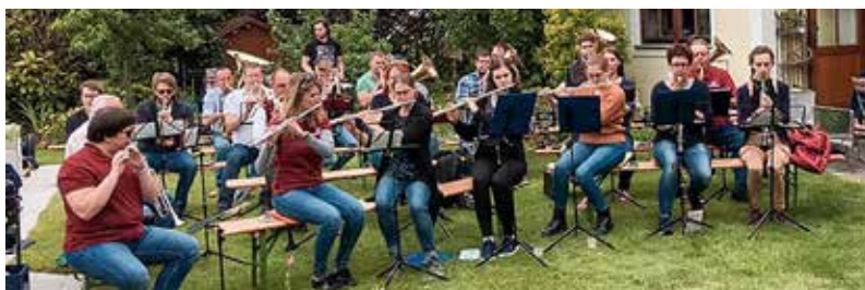
Die Musiker des Bläserkorps Hollenburg-Wagram bei der Outdoor-Probe.

■ Die MusikerInnen des Bläserkorps Hollenburg-Wagram beendeten die probenfreie Zeit mit einer Outdoor-Garten-Probe Mitte Juni.