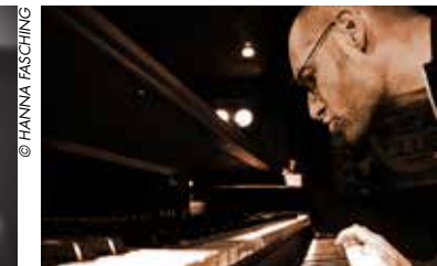
Konzert Jo Aldingers DOWNBEATCLUB

Gemeinsam ist das Ehepaar Atzmüller ab sofort wieder für Sie da. Bei Bedarf werden Akuttermine auch kurzfristig vergeben. Einfach anrufen und informieren. 02783/20230 , www.praxis-atzmueller.at