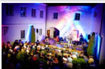
Bilder © Jo Bauer, Saschas Artzone, Günther Böck/Fine Art Galerie.