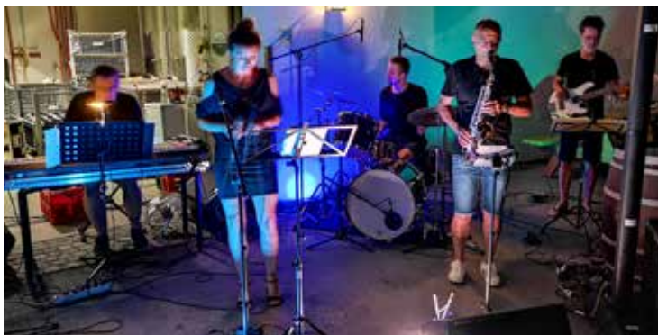
„Wein & Jazz“ mit der Stageband der Musikschule Traismauer im Weingut Haimel.

Eine Anmeldung zu einer kostenlosen Schnupperstunde ist im Se-