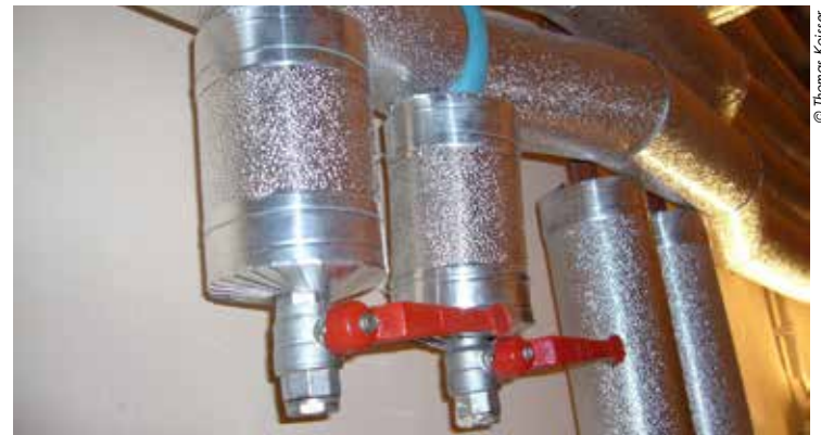
Ungedämmte Heizungsrohre sind unbeachtete Energiefresser.

Unbeachtete Energiefresser sind ungedämmte Heizungsrohre. Durch das Dämmen der Heizungsrohre gelangt die Wärme genau dorthin, wo sie gebraucht wird: In die Wohnräume! Das