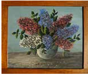
Josef Reiter, Flieder in Vase