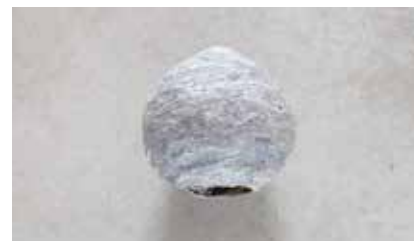
Fotografie & Architektur Maarten Rots, Lea Titz

FineArt Galerie öffnet auch zu den Tagen der offenen Ateliers. Gerne führen wir Sie durch unser aktuelles Projekt Fotografie & Architektur mit Lea Titz und Maarten Rots.