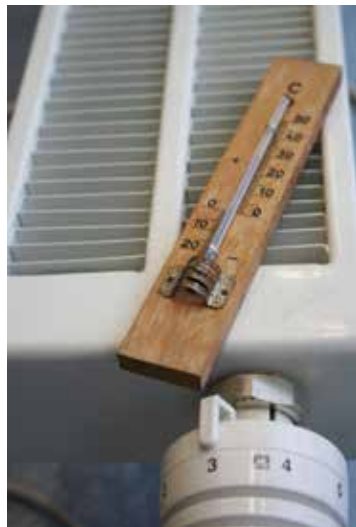
In manchen Räumen kann im Vergleich zu anderen die Temperatur abgesenkt werden.

Nicht alle Räume müssen gleich stark beheizt werden: In Wohnräumen liegt bei alten Gebäuden die Wohlfühl-Temperatur bei etwa 22 °C, am Gang, in Schlaf- und Abstellräumen kann die Temperatur abgesenkt werden. Wenn ungenutzte Räume genauso beheizt werden wie Aufenthaltsräume, geht viel wertvolle Energie verloren. Die Absenkung der Raumtemperatur um nur 1 °C bringt bereits eine Energieersparnis von 6 Prozent! Ein Thermostatventil hilft die Temperatur in jedem Zimmer zu regulieren: Das Ventil dreht die Heizung ab einem bestimmten, eingestellten Richtwert einfach ab!