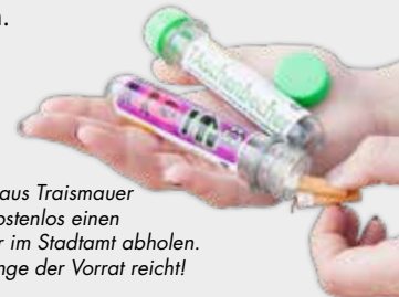
Bürger*innen aus Traismauer können sich kostenlos einen Taschenbecher im Stadtamt abholen. Ausgabe solange der Vorrat reicht!

■ Etwa 80 Prozent der Zigarettenstummel weltweit landen durch unachtsames Entsorgen in der Natur und gelangen so in unsere Natur und Umwelt. 1,5 Milliarden Zigaretten werden jährlich in Österreich geraucht. Dadurch fallen rund 5.000 Tonnen Zigarettenstummel an.