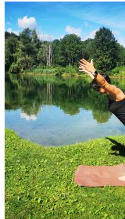
Neben anderen Faktoren bilden Bewegung, Training und Sport einen gesunden Lebensstil. Welche Art von Bewegung oder Sport man wählen sollte, sollte man selbst überlassen.

Sport stimmt, durch die Ausschüttung von „Glückshormonen“, optimistisch und vermittelt ein gutes Körperbewusstsein. Damit steigt meist auch das Selbstwertgefühl. Körperliche Aktivität kann deshalb bei Stimmungsschwankungen gut helfen. Diese so genannten Endorphine sind körpereigene Hormone, das heißt, unser Körper produziert sie selbst und sie müssen nicht über die Nahrung aufgenom-