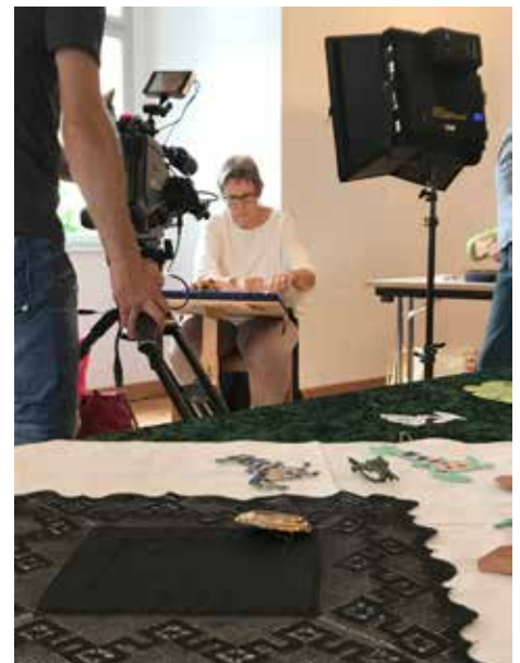
Aufnahmen des ORF im Schloss Trismauer

Dieser wird aufgrund der Covid-19-Lage auf Oktober 2021 verschoben. Das hat der Verein für Klöppeln und Textile Spitzenkunst in Österreich gemeinsam mit der Stadtgemeinde entschieden. Das Programm mit Spitzenausstellungen, Vorträgen sowie der Festabend und eine Produktausstellung der Händler wird im Wesentlichen unverändert bleiben.