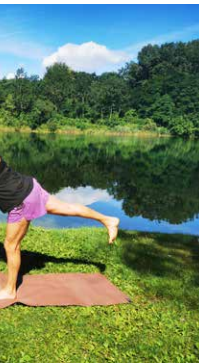
Training und Sport die Grundlage für einen gesunden Körper. Letztendlich gewählt wird, bleibt dabei jedem

ihnen, wie lange Zeit üblich, Pillen zu verabreichen. Auch bei den Volkskrankheiten wie Osteoporose, Depression, rheumatischer Gelenkverschleiß, chronische Rückenschmerzen und vieles mehr, erhalten die erkrankten Menschen immer häufiger regelmäßige Bewegung verordnet.