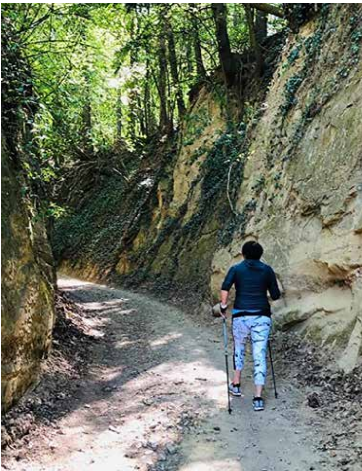
Menschen, die regelmäßig sportlich aktiv sind, wissen die wohltuende und positive Wirkung des Sports sehr zu schätzen.

Welche Art von Bewegung oder Sport letztendlich gewählt wird, bleibt dabei jedem selbst überlassen. Bei vorliegenden Erkrankungen sind möglicherweise nicht alle Sportarten geeignet, daher wird angeraten ein beratendes Gespräch beim Arzt zu führen und dann erst mit Sport zu beginnen! Menschen, die regelmäßig sportlich aktiv sind, wissen die wohltuende und positive Wirkung des Sports sehr zu schätzen und möchten dieses Lebensgefühl nicht mehr missen.