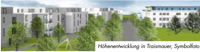
Höhenentwicklung in Trismauer, Symbolfoto.

■ In den letzten Jahren hat sich die Stadtgemeinde Trismauer zu einer Stadt entwickelt, die hohe Zuzugszahlen aufzuweisen hat. Das liegt sicherlich an der ausgezeichneten Lage: Einerseits hat die Stadt perfekte Verkehrsverbindungen nach Wien, St. Pölten, Tulln und Krems, andererseits kann Trismauer eine gute Infrastruktur für die hier lebende Bevölkerung aufweisen.