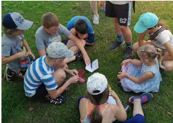
Die Kinder beim Lösen des Notenrätsels.