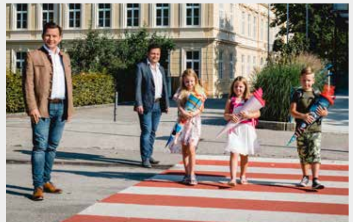
Bürgermeister Pfeffer und Stadtrat Rauscher freuen sich mit den Kindern über den Schulstart und wünschen eine schöne und vor allem gesunde Schulzeit.

■ Die Schule hat wieder begonnen, bitte achten Sie vor allem vor den Schulen, aber auch generell im Straßenverkehr auf unsere jüngsten Verkehrsteilnehmer.