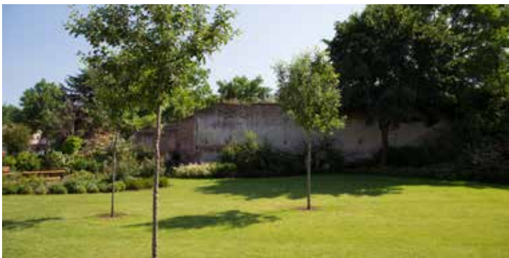
Der Stadtgrabenpark Trismauer wird ökologisch gestaltet und gepflegt.

■ Unsere Stadtgemeinde beteiligt sich am LEADER Programm „Ökologische Gestaltung und Pflege öffentlicher Grünräume“. Königsdisziplin der ökologischen, also giftfreien Pflege ist das Beseitigen von Unkraut auf Gehwegen, Straßen, auf den Friedhöfen und anderen Plätzen. Herbizide dürfen per Gesetz auf versiegelten Flächen nicht angewendet werden.