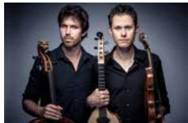
Konzert Bartholomey & Bittmann