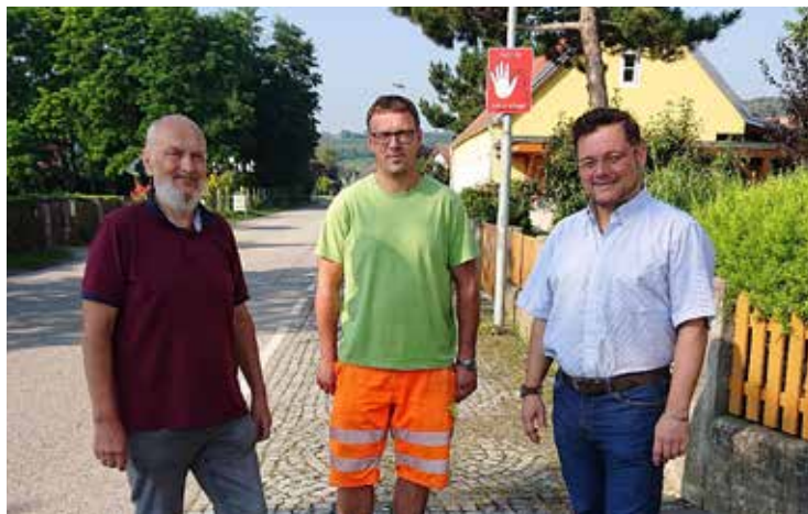
Auf Wunsch der Anrainer wurden, aufgrund von COVID-19 leider etwas verzögert, in der Ahrenberger Straße zwei Tafeln zur Geschwindigkeitsreduzierung angebracht.

Auf mehrfachen Wunsch der Bevölkerung hat sich die Stadt Trismauer dafür eingesetzt, dass ein Schutzweg im Bereich der Kreuzung LB43/Ing. Toder Gasse