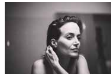
Konzert Susana Sawoff