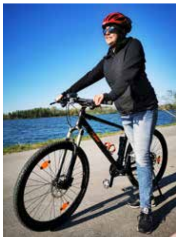
Durch regelmäßige Bewegung werden unsere körperliche Leistungsfähigkeit und die Funktion unserer Organsysteme erhalten.

Von Schonung zu Aktivität in jeder Altersgruppe, das ist mittlerweile klar nachgewiesen. Zappeligen Schulkindern wird Bewegung verschrieben, anstatt