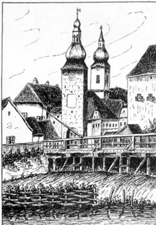
Traismauer, Fleischturm und Traisenbrücke um das Jahr 1800