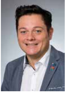
Bürgermeister Herbert Pfeffer