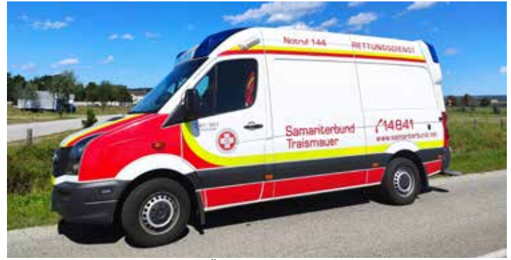
Das neue Rettungsfahrzeug für den ASBÖ-Stützpunkt Traismauer.

Beim Samariterbund kannst du dich engagieren und bei der Arbeit mit Menschen neue Erfahrungen sammeln.