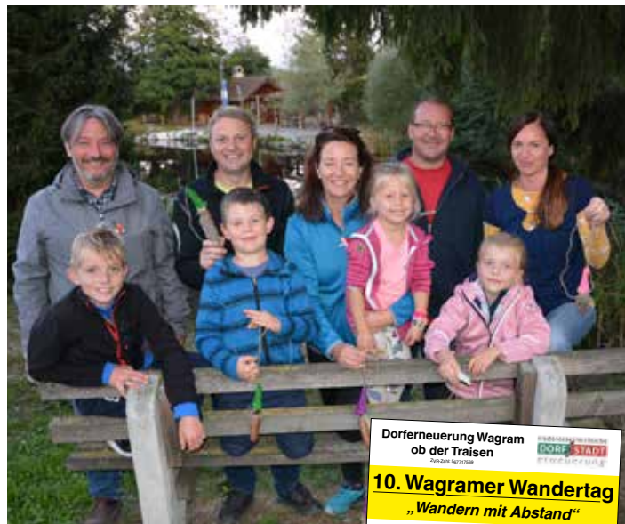
Der Wagramer Wandertag ist mittlerweile ein fixer Bestandteil im Trismaurer Veranstaltungskalender. Coronabedingt wird die zehnte Ausgabe dieser Veranstaltung im Jahr 2021 stattfinden.