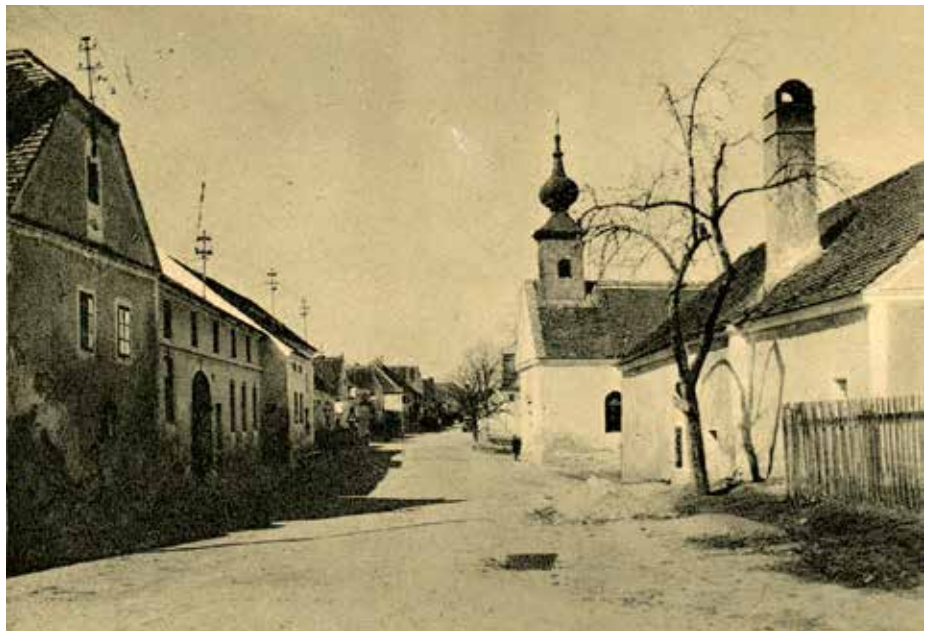
Alte Ansicht mit Blick in die Ortsstraße von Gemeinlebarn.

Am 28. April 1769 – heuer vor 250 Jahren - wurde die Bauerlaubnis erteilt und Gemeinlebarn hatte nun eine eigene Kapelle, in der jedoch keine hl. Messe gelesen werden durfte. Nach etwa 125 Jahren errichtete man schließlich ein gemauertes Bethaus, das am 19. September 1897 vom Stollhof-