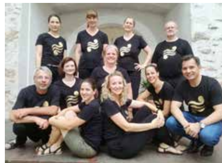
Klasse Bläser: Gruppe des Projekts vom Sommersemester.

wirklich bereits ein kleines Orchester entstanden ist. Ein Beweis war das Brassfestival 2019, wo die Gruppe zum ersten Mal gemeinsam auftrat.