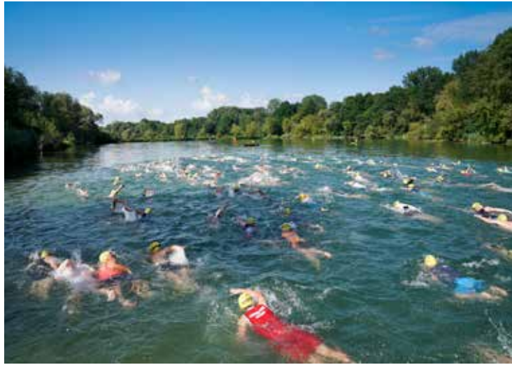
Die Schwimmstrecke führte die Triathleten durch den Badensee Trismauer.

Der Bewerb wurde in der Olympischen Distanz, als auch in einer Sprintdistanz geführt, außerdem