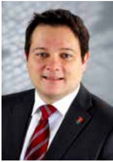
Bürgermeister Herbert Pfeffer