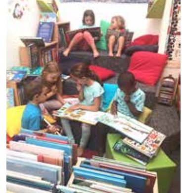
Die Kinder schmökern gerne in den vielen neuen Kinder- und Jugendbüchern.