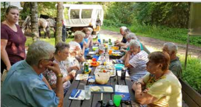
Am 1. August 2019 fand eine Kutschenfahrt mit 14 Personen statt. Gestartet wurde an diesem Tag bei herrlichem Wetter in Gemeinlebar. Weiter ging es zwischen den Feldern über Stollhofen und Traismauer, Richtung Oberndorf. Beim St. Georgsplatz gab es ein genussvolles Picknick mit Köstlichkeiten aus der Region.