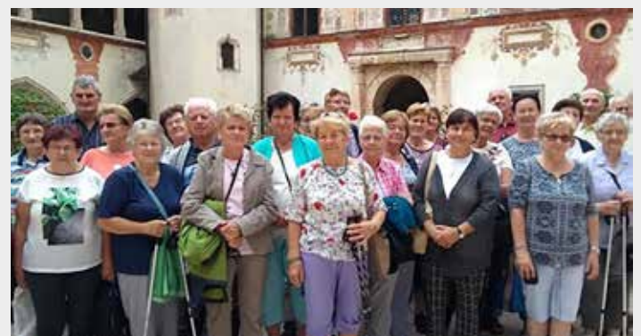
Im Rahmen einer 5-tägigen Reise nach Tirol besichtigten die Senioren das im Inntal weithin sichtbare, geschichtsträchtige Schloss Tratzberg.