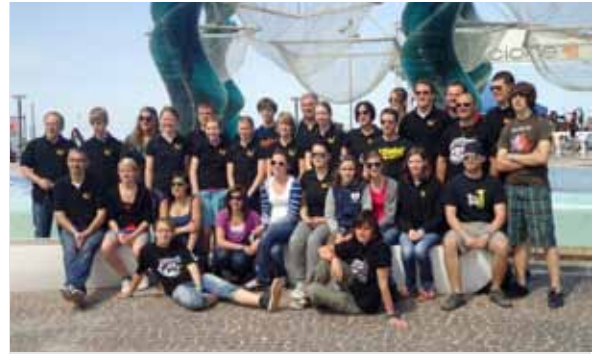
Jugend Musikfestival „Allegromosso“ in Italien.