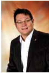
Bürgermeister Herbert Pfeffer

■ In der Sitzung am 25. April 2012 beschloss der Traismauer Gemeinderat die Abhaltung einer Volksbefragung zum Thema „Umfahrung LB43“. Als Tag der Volksbefragung wurde der 24. Juni 2012 fixiert.