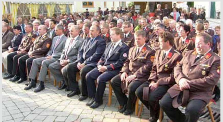
Ehrgäste bei der diesjährigen Florianifeier in Frauendorf.

■Die diesjährige Floriani-Feier stand im Zeichen des 120-jährigen Bestehens der FF-Frauendorf.