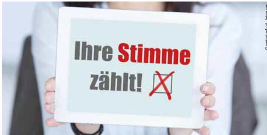
Das Ergebnis der Volksbefragung wird mittels Resolution im Gemeinderat dem Land Niederösterreich mitgeteilt.

ansteigen wird, geben berechtigten Anlass, eine Umfahrung anzudenken - die freilich mit einem LKW-Durchfahrtsverbot durch die betroffenen Gebiete verbunden wäre.