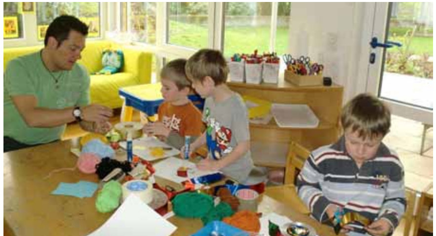
Ein ereignisreicher Vormittag für den Bürgermeister, der für alle viel zu schnell vorüber war.