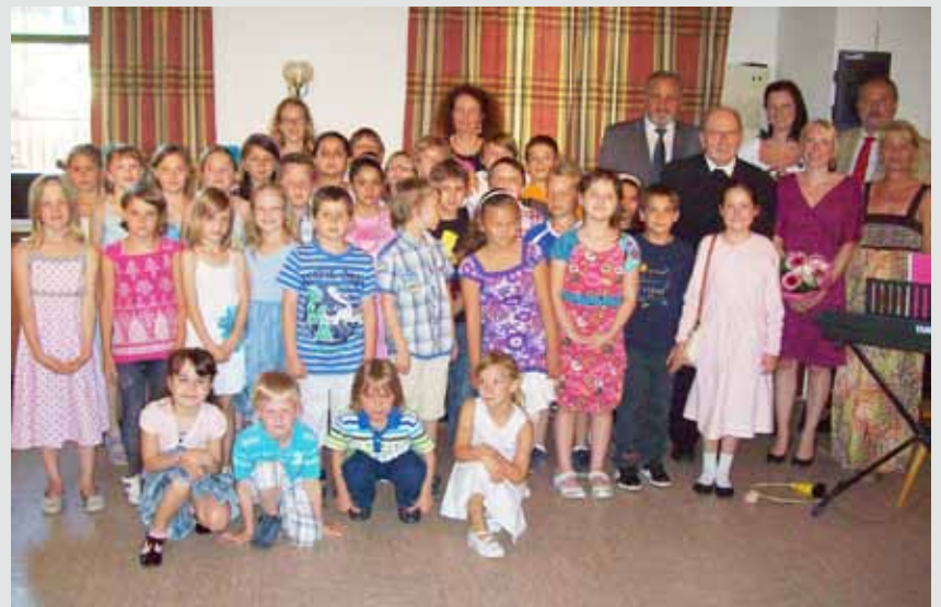
Muttertagsfeier der Stadtgemeinde Trismauer.