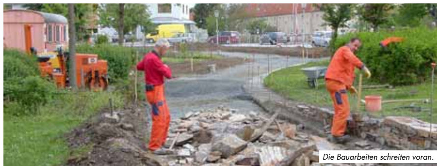
Die Bauarbeiten schreiten voran.

Auf Basis des Masterplans zur Neugestaltung des Stadtgrabenparks Trismauer zum öffentlichen Stadtpark wurde bereits im Herbst vorigen Jahres die Anbindung der Innenstadt durch die Stadtmauer im Bereich des Hungerturms hergestellt. Mit Unterstützung der Dorf- und Stadterneuerung erfolgt derzeit der Lückenschluss zwischen Hungerturm und dem Römertor.